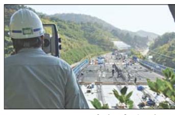
TSとCIMで床版高を確認

山口県土木建設部・道路整備課は、一般国道437号「大島大橋」(鋼3径間トラス橋、橋長1020m)の応急復旧を完了させ、11月27日、交通規制を解除した。同橋は10月22日にドイツ海運会社の貨物船が衝突して損傷していた。県は被災状況の調査を、同橋の定期点検を委託していた長大に改めて委託。調査・応急復旧・本復旧は、新設時に施工した日本鋼管の後継J F Eエンジニアリングと約23億円で契約している。本復旧方針は検討中だ。